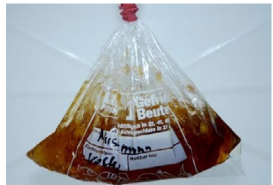
Futterkranzproben im Beutel