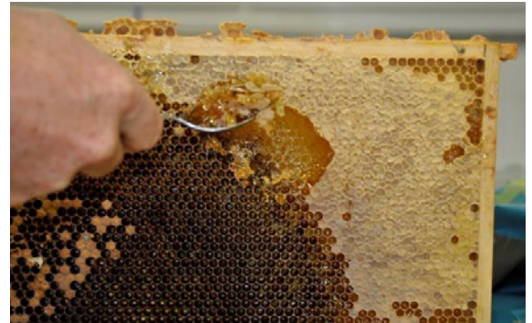
Futterkranzprobennahme mit einem Löffel