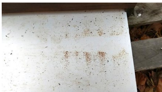
Schieber unter dem Lüftungsgitter zur Sammlung des Gemülls nach 2 Wochen im November