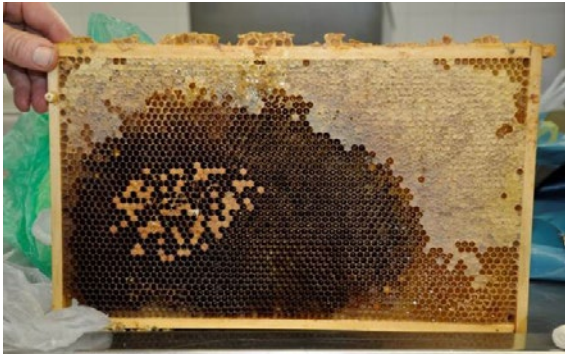
Brutwabe mit breitem Futterkranz

Hinweis: bei Verwendung von Einweglöffeln bitte Löffel nicht mit in die Probentüte stecken.