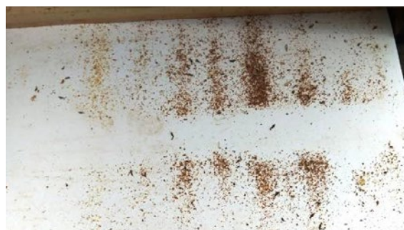
Schieber unter dem Lüftungsgitter zur Sammlung des Gemülls nach 8 Wochen